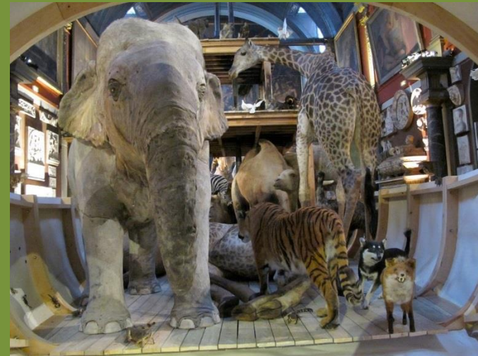
Huang Yongping, Arche, 2009-10