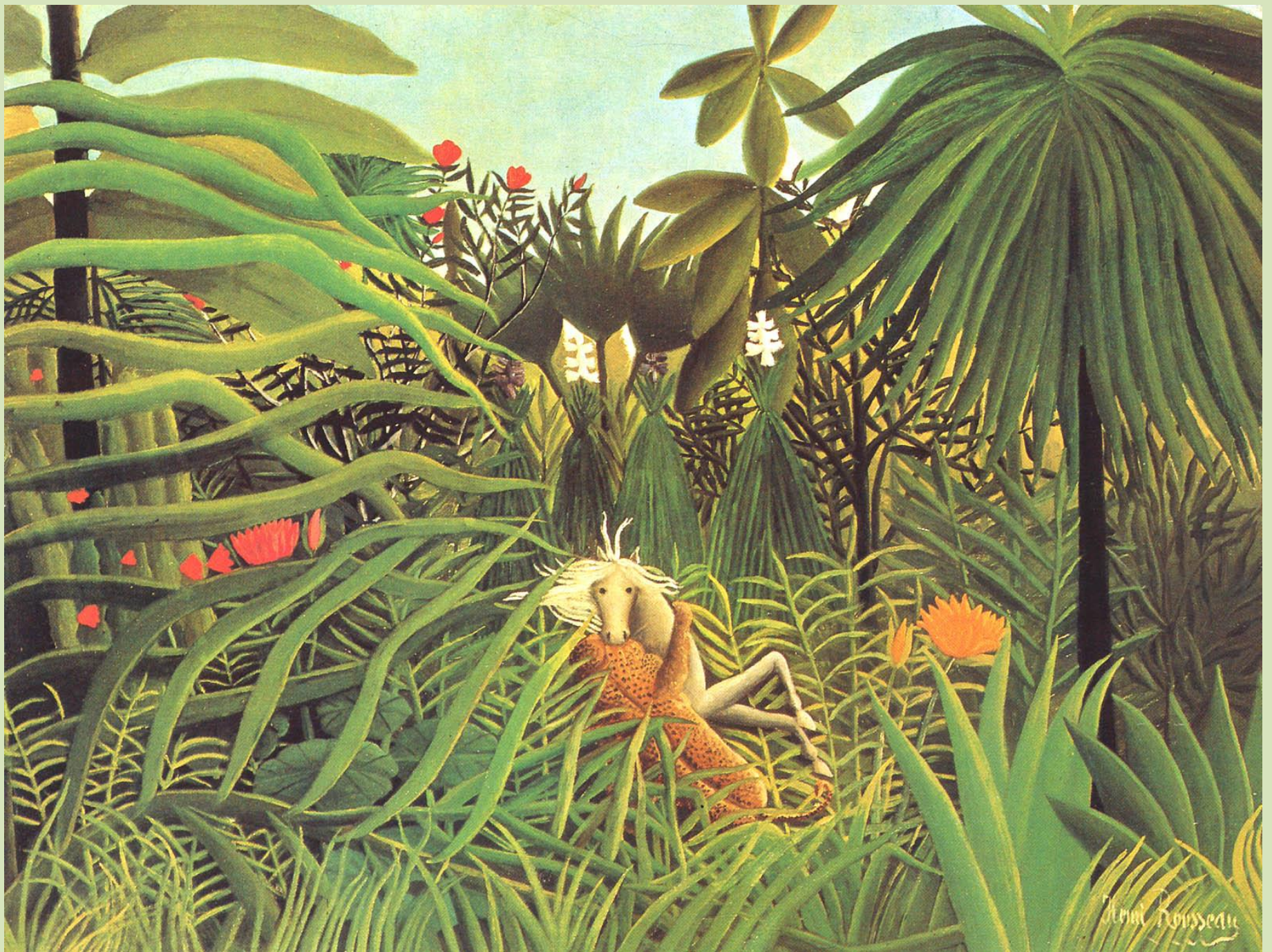
H. Rousseau, Cheval attaqué par un jaguar, 1910, Moscou