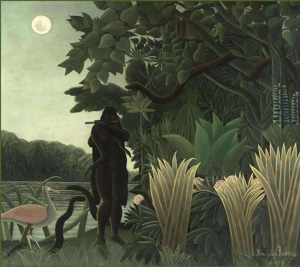
H. Rousseau, La charmeuse de serpents, 1907, Paris