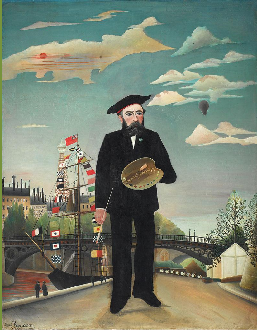
H. Rousseau, Portrait paysage, 1890, Prague