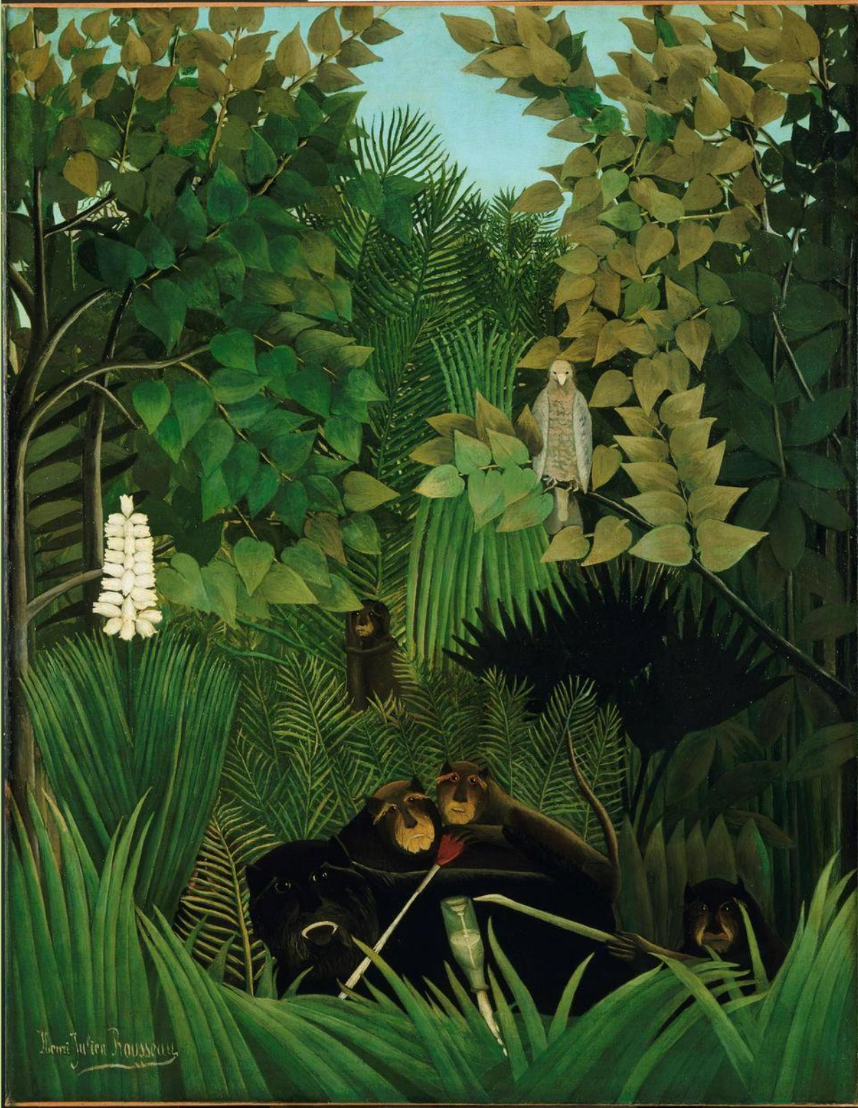
H. Rousseau, Joyeux farceurs, 1906, Philadelphie