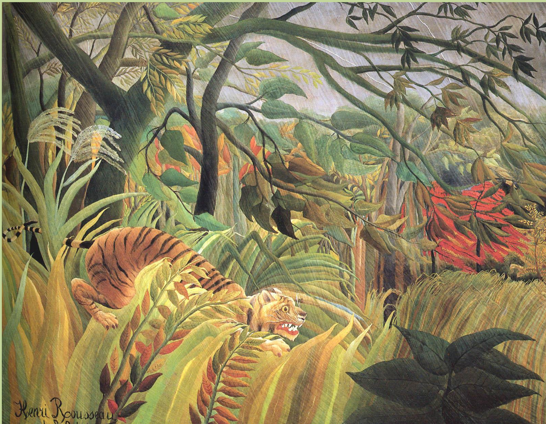
H. Rousseau, Surpris !, 1891, Londres