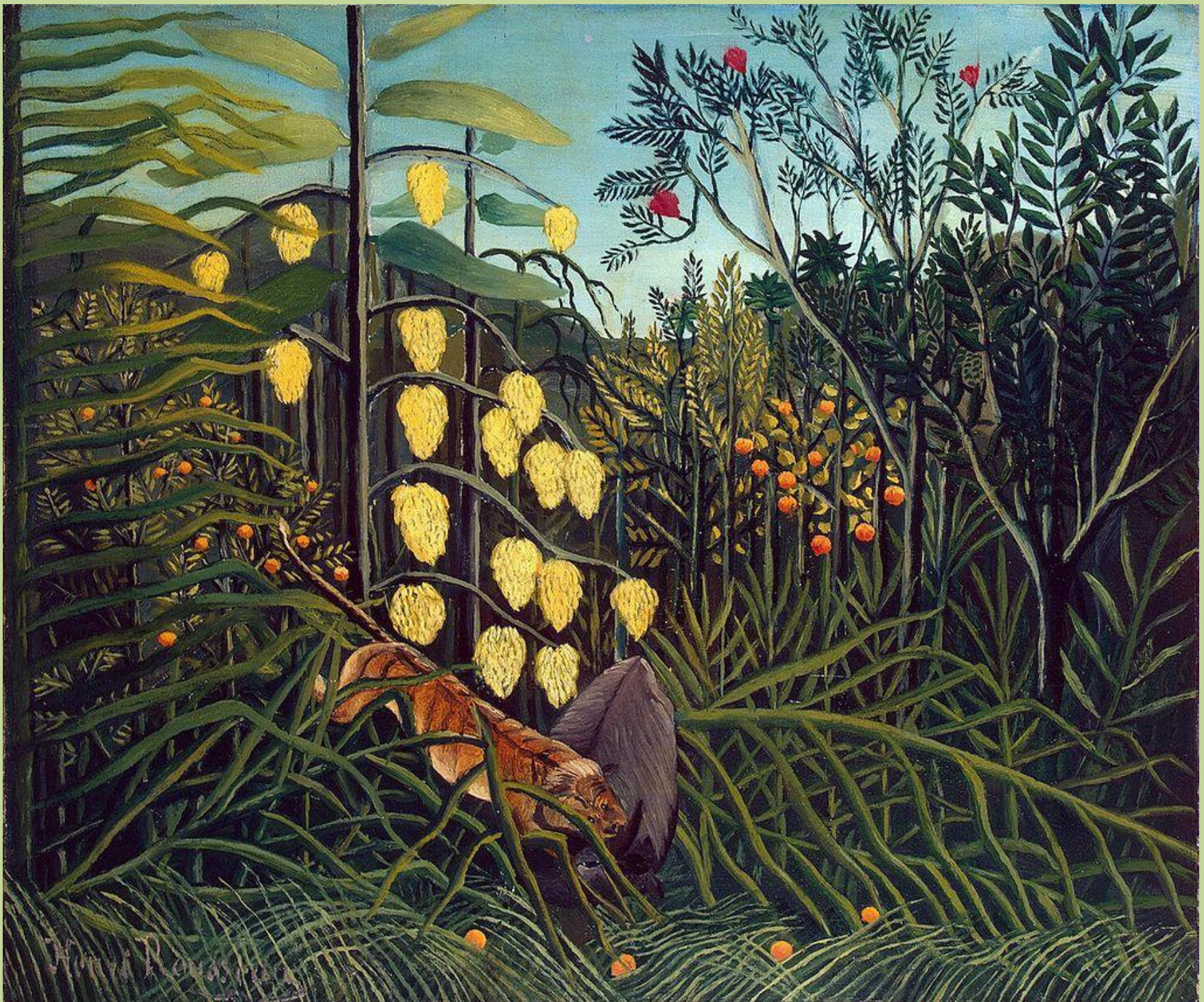
H. Rousseau, Combat de tigre et buffle , 1908, Cleveland