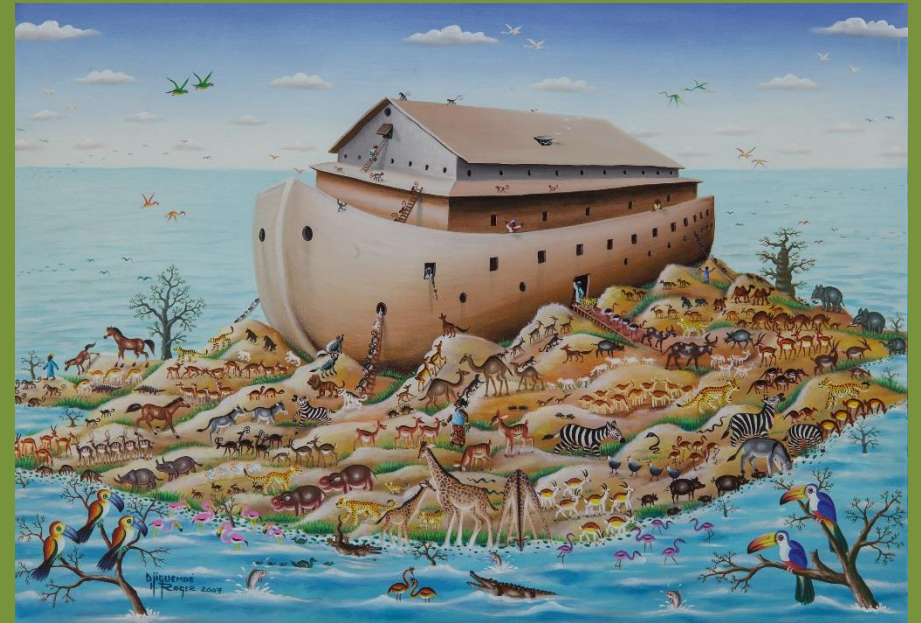
R. Djiguemdé, Le Nouveau Monde, 2007, Laval